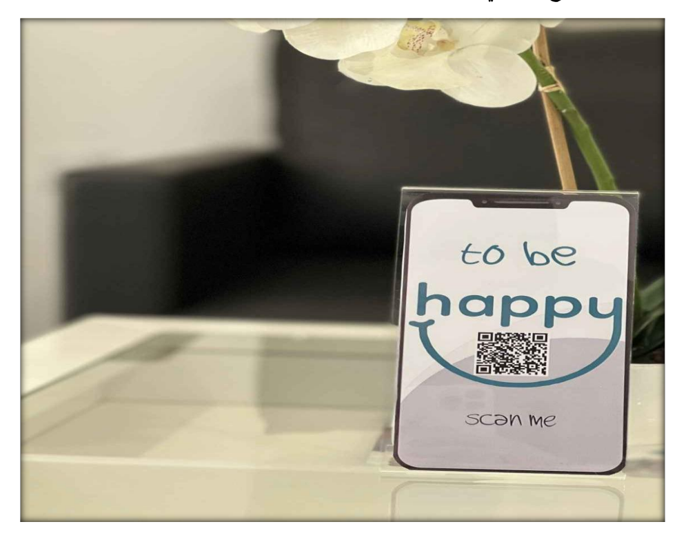
المشروع الثالث: مشروع الزكاة

إن مواكبة التطور التكنولوجي تساهم في تطبيق الخطط الدعوية، ولاشك أن لجنة التعريف بالإسلام قد استفادت من هذه الحيثية، وهي مشعل نور في طريق نشر العقيدة من خلال المسح الضوئي ما يعرف بالكود.